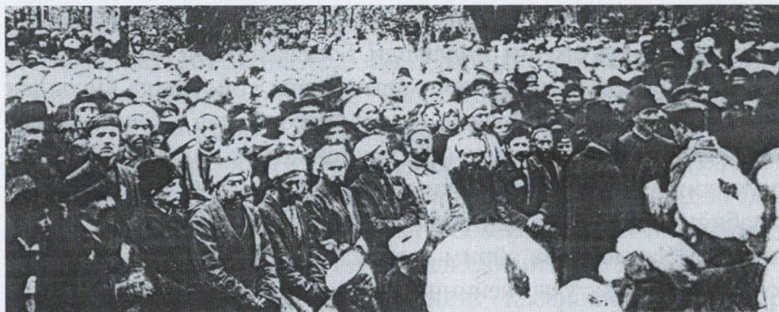
Туркистон Миллий Мажлиси аъзолари халқ олдида