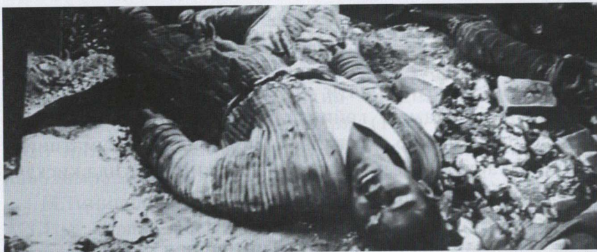
1918 йил февралдаги Қўқон фожиаси

сифатида қабул қилинди. Туркистонликлар тинч йўл (парламент) билан миллий давлатчиликни қайта тиклаш мумкин эмаслигини тушуниб, 1918 йил февраль ойининг охирида қўлларига қурол олган ҳолатда Туркистонда совет режими ва большевикларга қарши қуролли ҳаракатни бошлаб юбордилар. Совет даврида “босмачилик” ҳаракати деб қораланган туркистонликларнинг мазкур миллий озодлик кураши тарихга истиқдолчилик ҳаракати сифатида кирди.